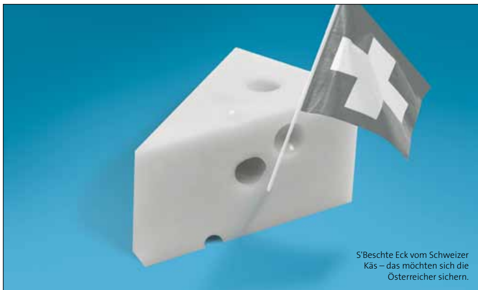
S'Beschte Eck vom Schweizer Käs – das möchten sich die Österreicher sichern.