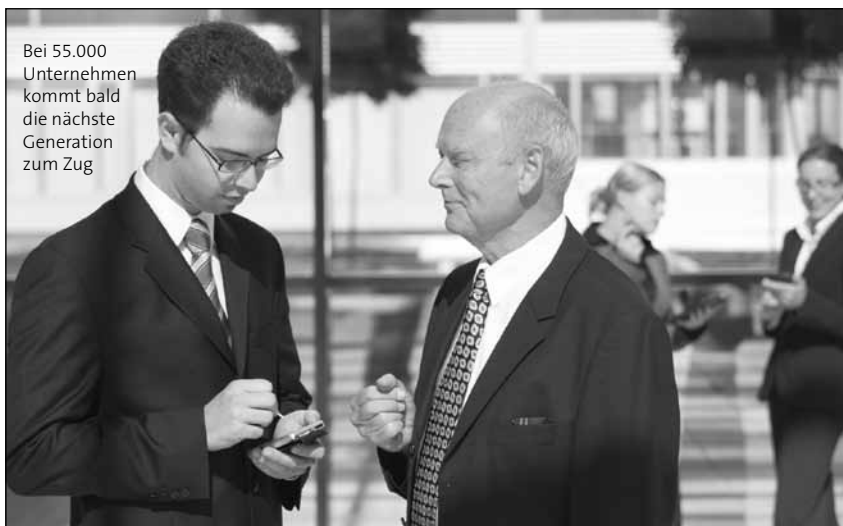
Bei 55.000 Unternehmen kommt bald die nächste Generation zum Zug