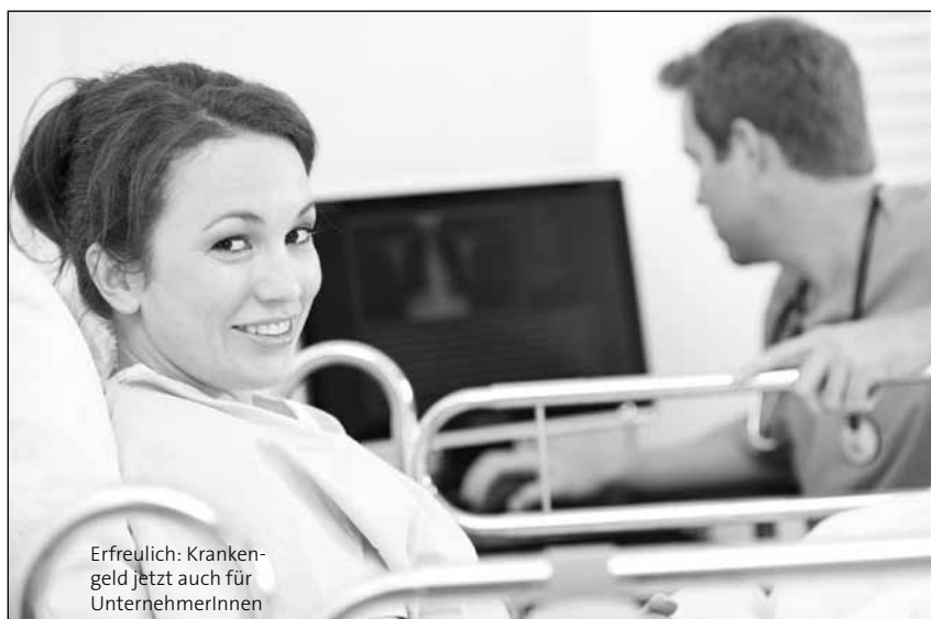
Erfreulich: Krankengeld jetzt auch für UnternehmerInnen

Die Unterstützungsleistung beträgt 26,97 € pro Tag, der Betrag wird jährlich valorisiert. Die Finanzierung erfolgt über die AUVA. Gleichzeitig bleibt die Möglichkeit der im GSVG verankerten Zusatzversicherung bestehen. ●